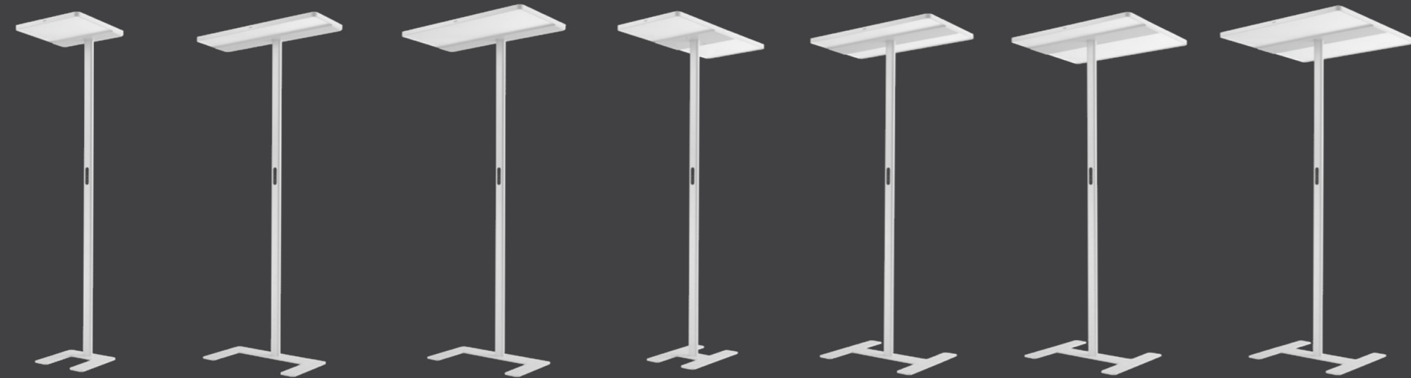
1DS 1 Desk Side