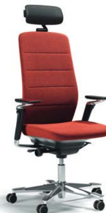
CF121 (Armlehne + NC-Nackenstütze)