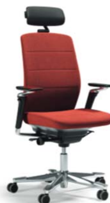
CF111 (Armlehne + NC-Nackenstütze)