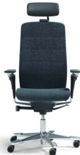
Polished Edition (EDP)