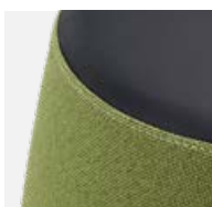
Zweifarbige Gestaltung möglich