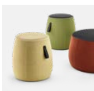
Harmonisches, organisches Design

Die leichten Hocker sorgen für angenehme Atmosphäre und ermöglichen neue Gestaltungsansätze fürs Büro. Auch Unternehmensfarben lassen sich durch se:dot einfach abbilden – die große Auswahl an Farben und Materialien macht es möglich.