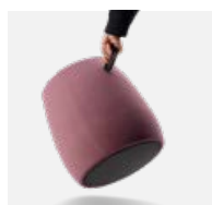
Seitliche Tragelaste aus Leder beim hohen Hocker