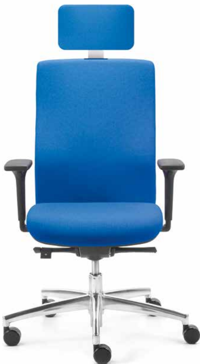
QS SM 9627 operator + Armlehnen | Armrests A441APO

The slim and elegant shape of the fully upholstered backrests provides optimal support when working, thanks to the anatomical backrest contour and full ergonomic specification.