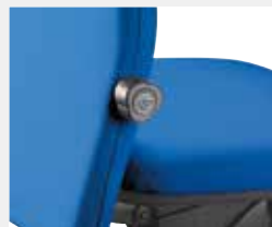
Lumbalstütze (L01): mechanisch 3,5 cm tiefenverstellbar. Lumbar support (L01): mechanically depth-adjustable (3.5 cm).