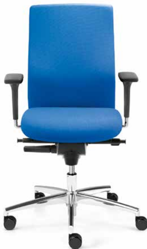
BS SM 9607 ST operator + Armlehnen | Armrests A441KGS