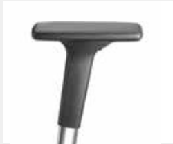
A341APO / A441APO (3F/4F) Armauflagen PU soft Armpads PU soft