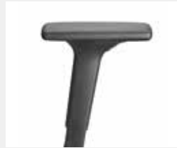
A341KGS / A348KGS* (3F) Armauflagen PU soft Armpads PU soft