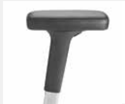
A442APO (4F) Leder-Armauflagen Leather armpads