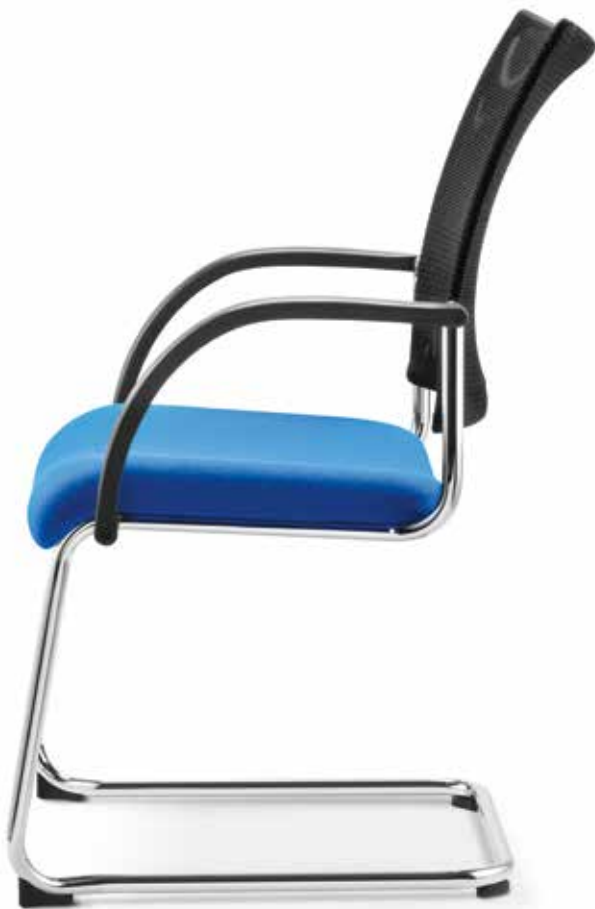
SM 8110 Armlehnen | Armrests AB04KGS (3fach stapelbar | stackable up to 3-high)

With their comfortable fully upholstered or mesh backrests, the four-legged chairs and cantilever chairs offer excellent seated comfort for guests and visitors and are the ideal accompaniment to the range of operator office swivel chairs.