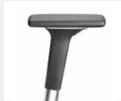
A541APO (5F) Armauflagen PU soft Armpads PU soft

*mit antibakterieller Mikrosilberausstattung zum Schutz vor Infektionen with antibacterial microsilver finish to help prevent infections