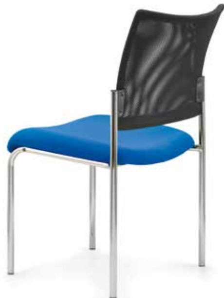
SM 8105 (6fach stapelbar | stackable up to 6-high)