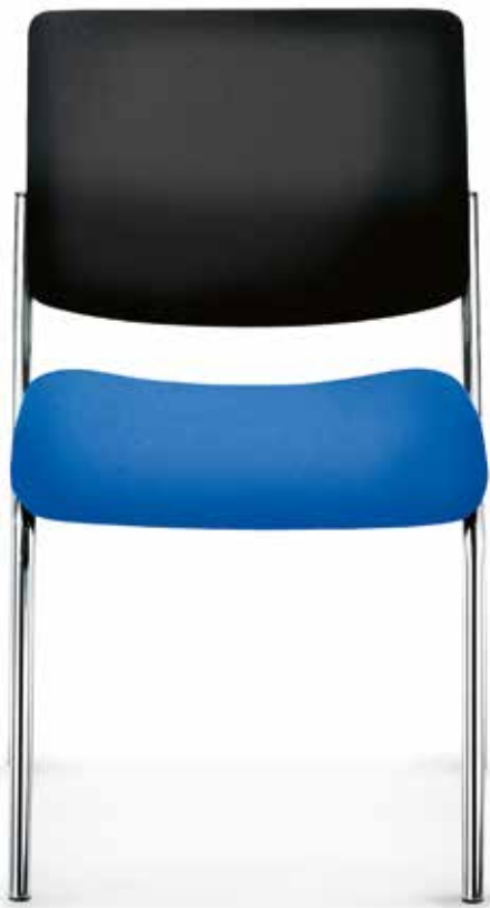
SM 9105 Armlehnen | Armrests AB04KGS (6fach stapelbar | stackable up to 6-high)