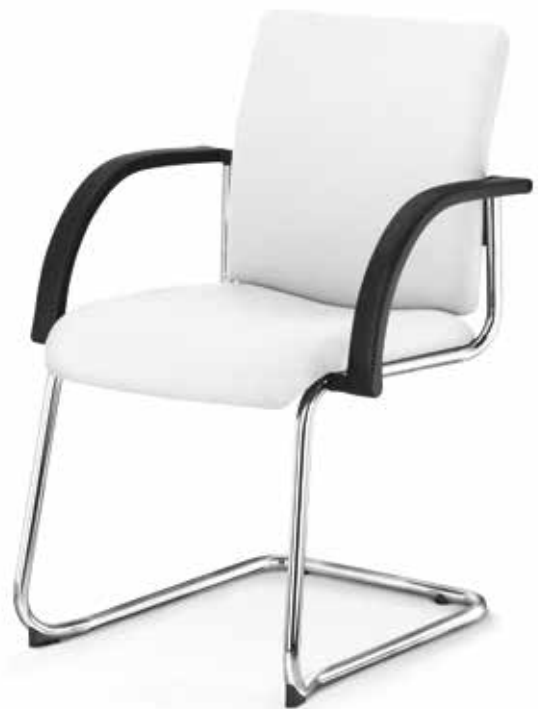
SM 9603 (3fach stapelbar | stackable up to 3-high)